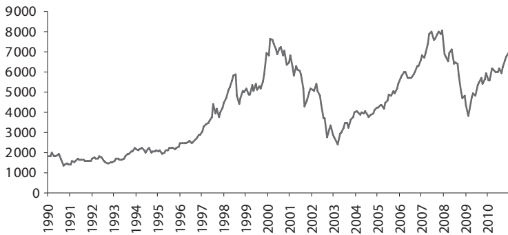
Abbildung 1.1: Verlauf des DAX (1990–2010)

Abbildung 1.1 zeigt den stark schwankenden Verlauf des DAX seit 1990. Hätte Sie im Vorhinein gewusst, dass es im Jahr 2003 wieder sicher und profitabel war, Aktien zu kaufen? Und wann wären Sie aus Aktien ausgestiegen? Im Jahr 2007, als die Börsen boomten?